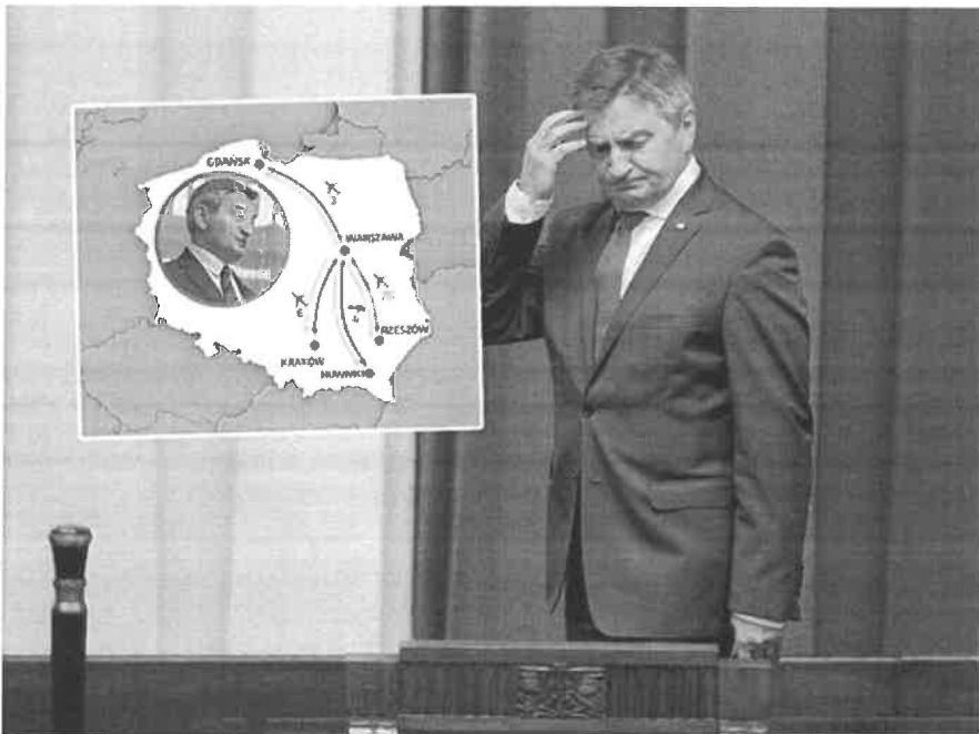
Marek Kuchciński i jego loty. Wykaz budzi wątpliwości